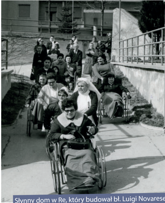
Słynny dom w Re, który budował bł. Luigi Novarese

Rozpoznanie: warunki ogólne umiarkowane z powodu prawej kończyny, która wobec lewej wygląda na 10 cm krótszą. Umiarkowany stopień hipertrofii uda. Przyjęty: 3.04.1930 roku. Wypisany: 18.05.1931 roku. Powód: warunki ogólne jak najlepsze" (MA, s. 79).