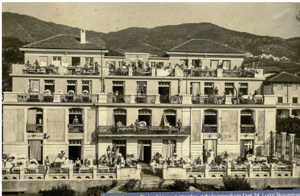
Sanatorium w Pietra Ligure z czasów, gdy kurował się tam bł. Luigi Novarese