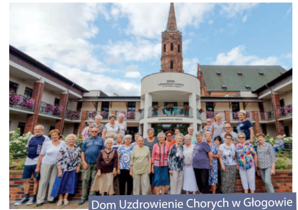
Dom Uzdrawienia Chorych w Głogowie