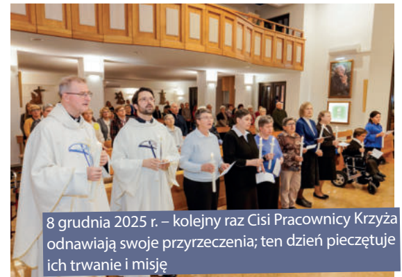
8 grudnia 2025 r. – kolejny raz Cisi Pracownicy Krzyża odnawiają swoje przyrzeczenia; ten dzień pieczętuje ich trwanie i misję

Od tamtego 1 listopada minęło już 75 lat, ale nie zmniejszyło się nasze zaangażowanie na rzecz ożywiania Centrum