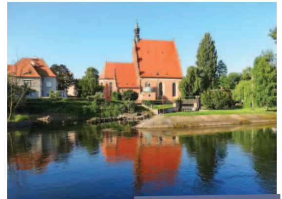
Bydgoszcz, widok na katedrę

Nie byłabym sobą, gdybym nie wspominała o zmianach w CVS w Olsztynie (czyli