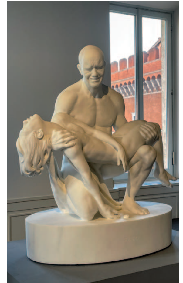
Rzeźba autorstwa włoskiego artysty Jago. Przedstawia współczesną pietę – Ojca trzymającego w objęciach zabitego Synka, ofiarę wojny w Syrii, w Aleppo.

Maryjo, Królowo Pokoju, módl się za nami!